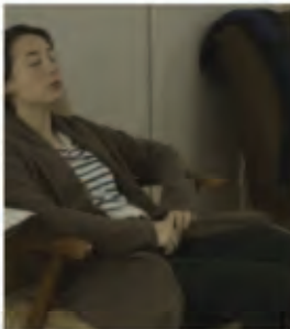
Una la guerra de imágenes