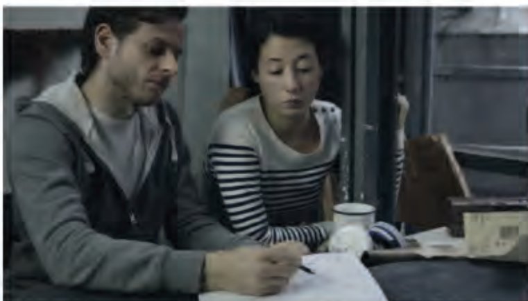
"El Vecino alemán" de Rosario Cervio et Martín Lij

R. C. : Quelle question polémique ! Avec mes amis jouant dans le film des universitaires et philosophes dans une scène de discussion avec la traductrice, nous avons abordé la responsabilité du gouvernement de Perón. Il est vrai qu'à la fin de la Seconde Guerre mondiale il y a eu tout un processus de création de faux papiers qui ont permis d'accueillir en Argentine des criminels de guerre. Certains n'étaient pas connus pour leurs agissements et d'autres si. On ne peut nier une complicité entre le gouvernement de Perón et certaines institutions du national-socialisme qui ont permis leur accueil en Argentine. Ces personnes ont été intégrées à la société argentine sans le moindre remords quant à ce qu'ils avaient pu faire durant la guerre. Il y eut des situations paradoxales, où des criminels de guerre en exil ont vécu en voisin d'une famille juive qui avait fui les persécutions en Europe. La Russie et les USA se sont également disputé la récupération de certains nazis, notamment des scientifiques et médecins. L'Argentine cherchait à récupérer d'autres types de nazis, notamment des personnes capables de développer son industrie de l'aviation.